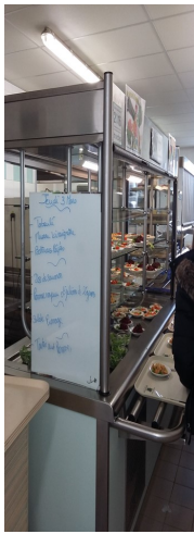
Article suite à notre immersion au self le jeudi 03 mars 2016 et à la collaboration de toute l'équipe.